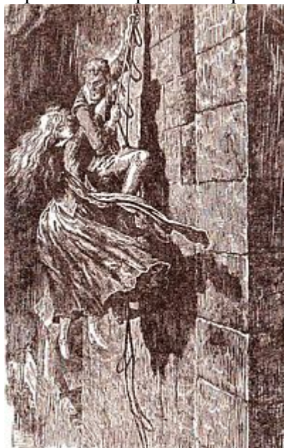
Лестница качалась в воздухе от яростных порывов ветра.

Фельтон начал медленно спускаться со ступеньки на ступеньку. Несмотря на тяжесть двух тел, лестница качалась в воздухе от яростных порывов ветра.